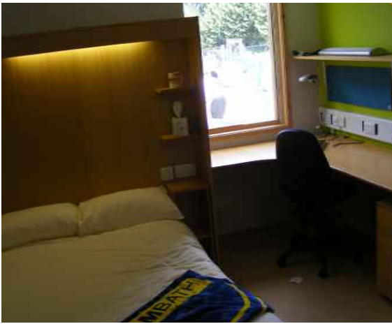
Одноместные комнаты с удобствами