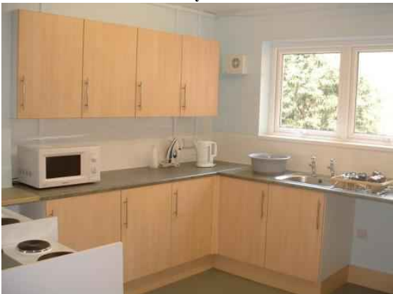
Вспомогательная кухня в резиденции